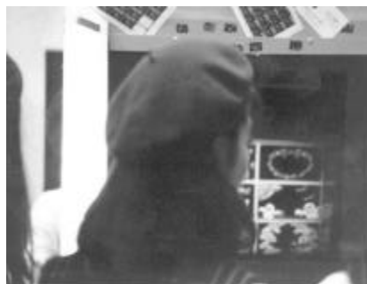
どれにしようかな